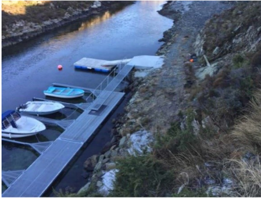
Foto av småbåtanlegg