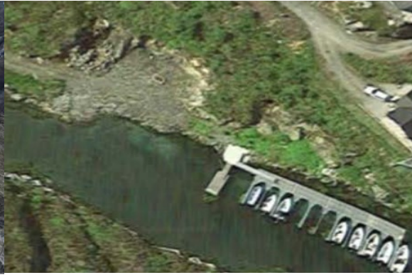
Planlagt naustområde vert på planert område over